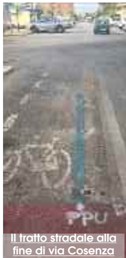
Il tratto stradale alla fine di via Cosenza