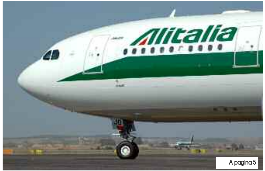
A pagina 5